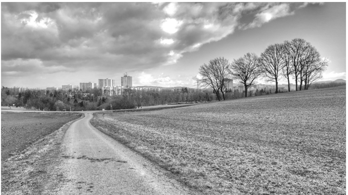
Blick von Westen aus auf das Roßdorf.

Also: Es kann gegrillt werden, aber mit Vorsicht! wow