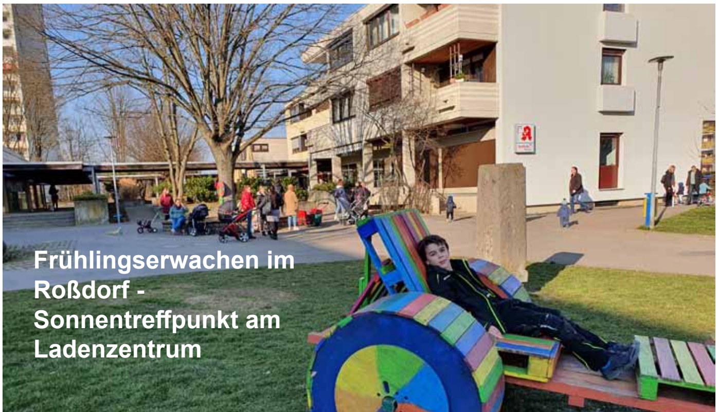
Frühlingserwachen im Roßdorf - Sonnentreffpunkt am Ladenzentrum