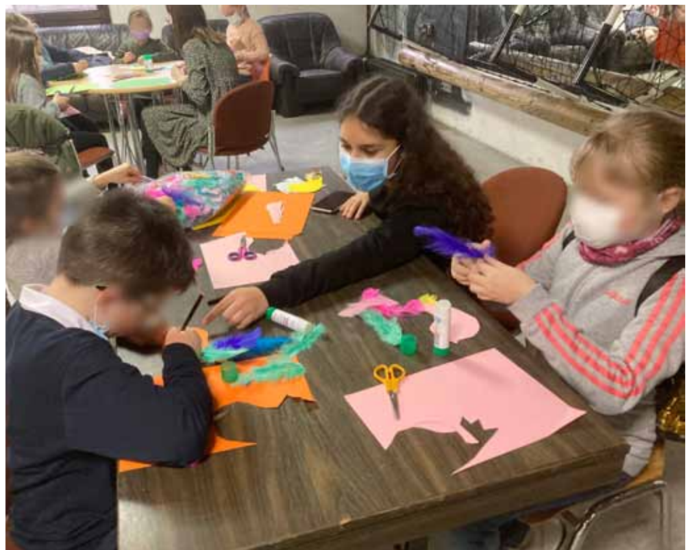
Die beiden Bilder entstanden beim Frühlingbasteln am 15. März 2022

Zusätzlich gibt es ca. alle zwei Wochen immer besondere Aktionstage, wo wir noch mehr Betreuer/innen sind als sonst und extra Angebote stattfinden. Am 15. März haben wir beispielsweise gemeinsam Frühlingssachen gebastelt. Da wurden verschiedene Blumen, Marienkäfer und Vögel ausgeschnitten, geklebt und angemalt. Die Ergebnisse können sich echt sehen lassen. Außerdem haben wir am 29. März offiziell unsere neue Spielbox eingeweiht mit einem großen Nachmittag, an dem wir mal alle neuen Spielsachen draußen ausprobiert haben.